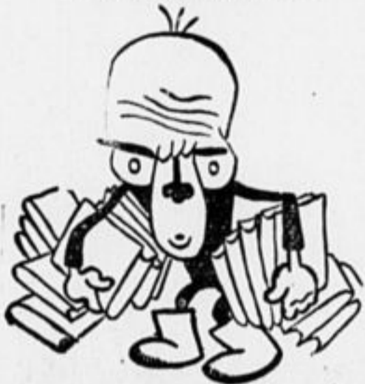
В меру все,—всегда полезно Чуть не в меру—вмиг скандал Книжный! Феденька! «болезньный!» На ного похож ты стал?