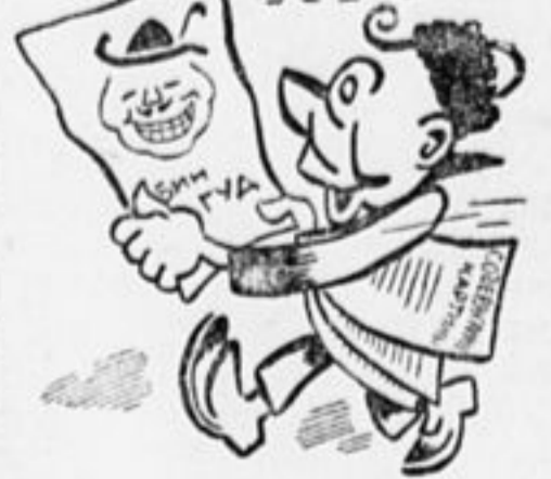
В одной руке — афиша В другой опять «кино» И стал похож наш Миша На фильму уж давно.