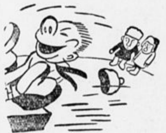
Рот широко раскрывая, Мчит на санках кованых Без вниманья оставляя Неорганизованных.